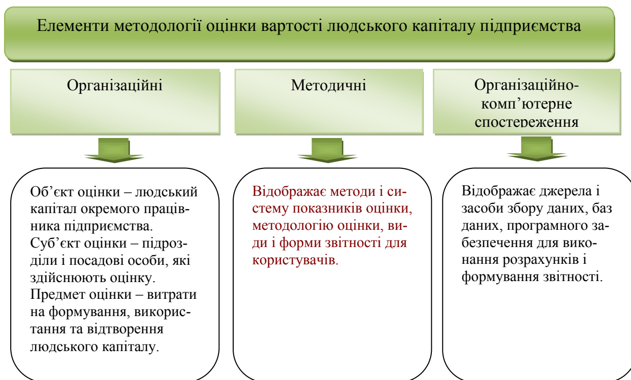
Рис. 3. Оцінка вартості людського капіталу підприємства*.

льності, яка невід’ємно належить працівникові і залежить від витрат на початковий капітал і винагород за ризики й часу капіталізації. Систематизація теоретичних підходів до визначення вартості дає змогу розробити методологію оцінки вартості людського капіталу (рис. 3).