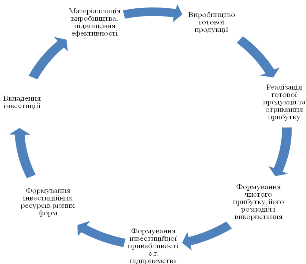
Рис. 3. Кругообіг інвестицій в сільському господарстві.*

Інвестиційна діяльність у сільському господарстві є однією з основних складових економічного й соціального розвитку як Тернопільської області, так і України загалом. Для того щоб інвестиційна діяльність була ефективною, потрібно чітко розуміти її економічний зміст (рис. 3).