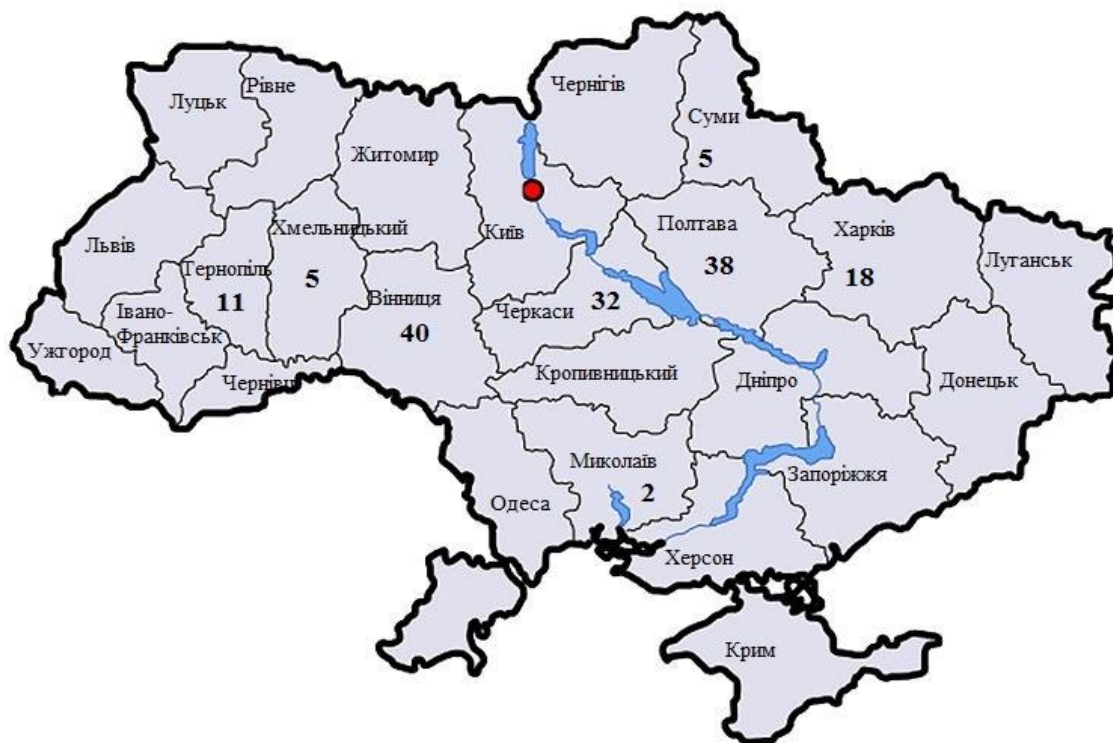
Рис. 4. Аграрні розписки у восьми пілотних областях.

України поширило впровадження аграрних розписок на Київську, Львівську та Одеську області. Згодом ця практика має охопити всю Україну. Так, протягом 2017 р. в Україні оформлено 151 аграрну розписку, з яких 62 товарні та 89 фінансових. Успішно виконано та закрито 58 аграрних розписок (рис. 4).