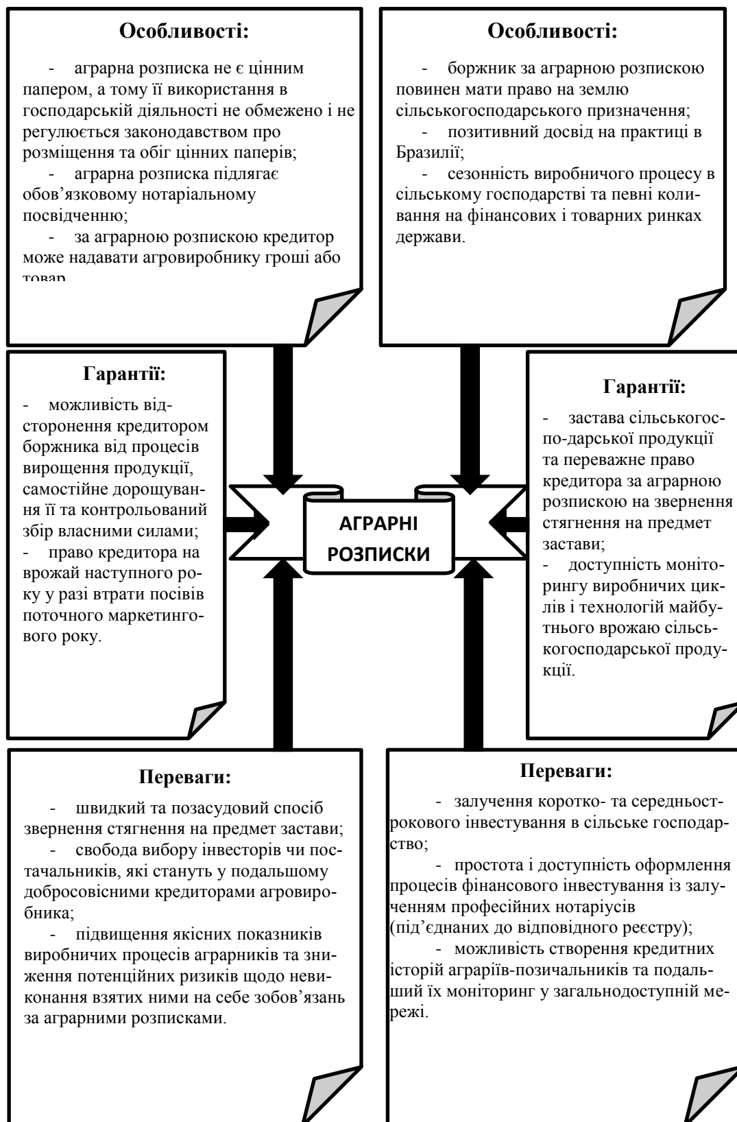
Рис. 2. Характеристика аграрних розписок як інноваційного способу залучення фінансування агровиробників*.