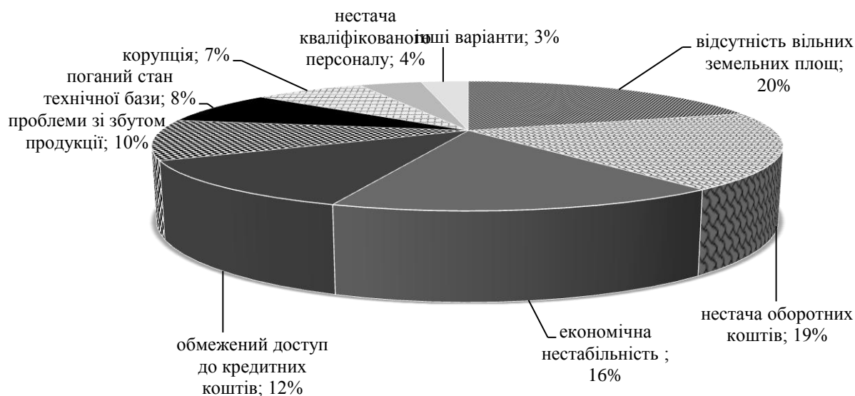
Рис. 1. Вплив різних чинників на аграрний бізнес.*

Методика дослідження та матеріали. У ході досліджень задіяно комплекс методів, зокрема безпосередній опис досліджуваного явища, опрацювання статистичної інформації за допомогою економічних методів дослідження, представлення одержаних результатів за допомогою табличної форми та графічного методу.