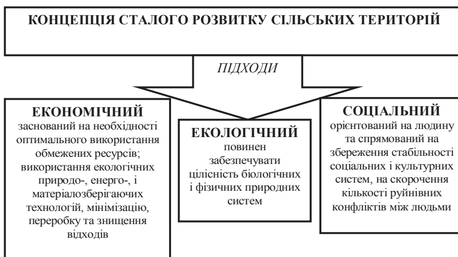
Рис. 2 Підходи до вирішення проблемних питань сталого розвитку сільських територій.*

*Узагальнено авторами на основі (Латинін, 2006; Петрушевська, 2014).