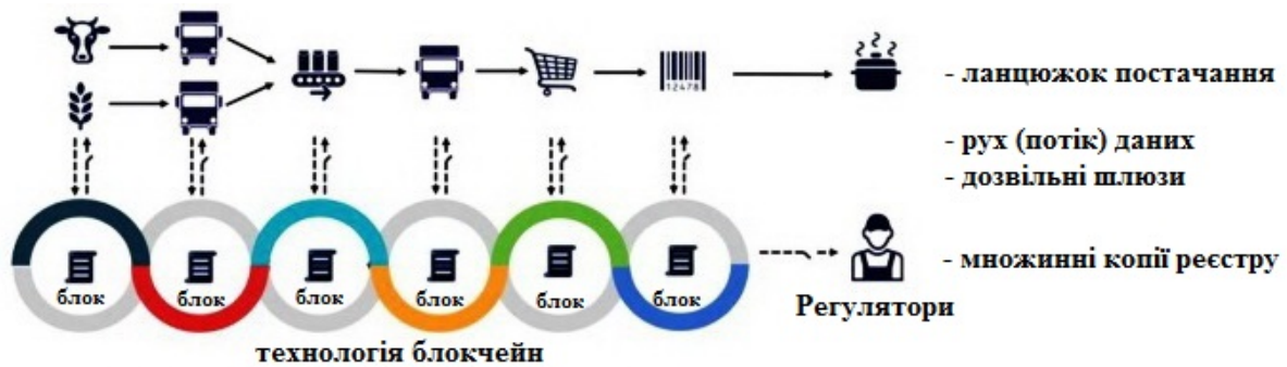
Рис. 2. Схема відстеження потоку даних у ланцюжку постачання харчової продукції за взаємодії технології блокчейн (технології розподіленого реєстру).