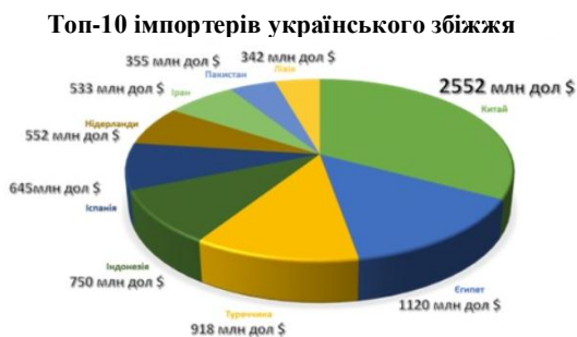
Рис. 2. Топ-10 імпортерів українського збіжжя, 2020 р.

Колишній лідер рейтингу найбільших імпортерів вітчизняних зернових Єгипет у 2020 році закупив українського збіжжя на 1120 млн дол. США. Туреччина, яка 2020 року посідала лише шосте місце у топ-10, торік перемістилася на третє, збільшивши обсяги закупівель українського збіжжя до 918 млн дол. США (Україна годує 400 млн людей у світі, 2022) (рис. 2).